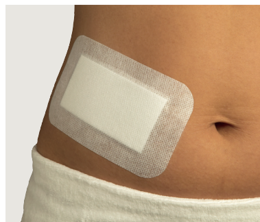
Fäst förbandet på huden utan att sträcka det och ta försiktigt bort resten av skyddspapperet. Stryk och värm med handen över kanterna så att förbandet fäster ordentligt.