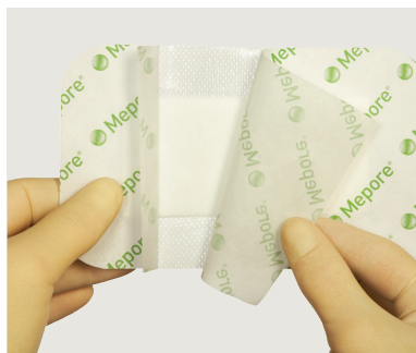
Öppna förpackningen och ta ut förbandet.