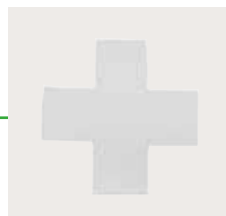
Mepilex 10x10 cm