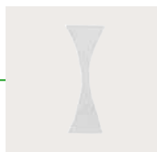
Mepilex 10x10 cm