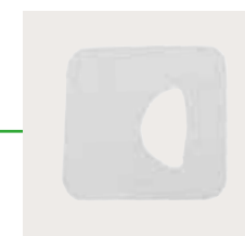
Mepilex 10x10 cm