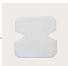
Mepilex 10x10 cm