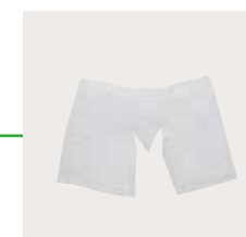
Mepilex 10x10 cm