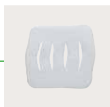
Mepilex 10x10 cm eller 10x20 cm