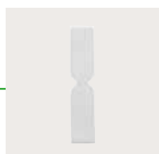
Mepilex 10x10 cm