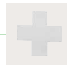
Mepilex 20x20 cm